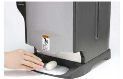
シャリ玉を取ると次のシャリ玉が 出てくるAUTOモード