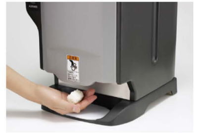
手を伸ばすとシャリ玉が出てくる HANDモード