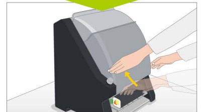
すぐ上にあるスタートスイッチを押します