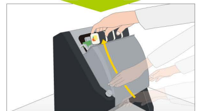
そのまま手を上に移動させ、カットされたのり巻きを取り上げます

カット時間を大幅短縮！ だれでもかんたん素早いカット 見栄えもよくなり売り上げアップ！